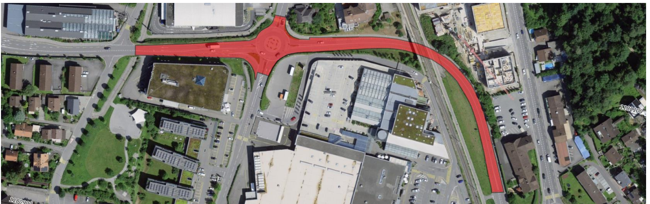
Abbildung 1: Übersicht

Die Arbeiten sind witterungsabhängig und werden, falls notwendig auf die nächstmögliche Nacht verschoben.