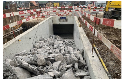
Heimberg: Rückbau alte Treppe Ost