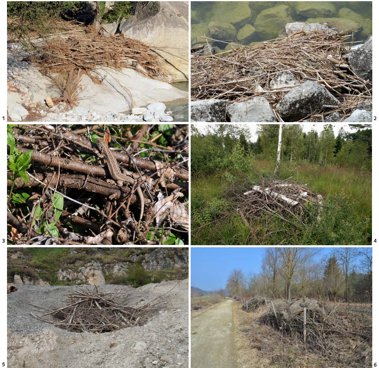
Abb. 1 Grosser, natürlicherweise entstandener Schwemmhohlaufen am Ufer des Brenno im Tessin. Verschiedene Reptilienarten finden hier geeignete Versteck- und Sonnenplätze. Auch als Winterquartier oder Eiablagestelle kann ein solcher Haufen dienen. (AM)